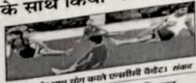
परिवार के साथ योग करते एनसीसी कैंडिड।