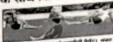
परिवार के साथ योग करने एनसीसी कैम्प