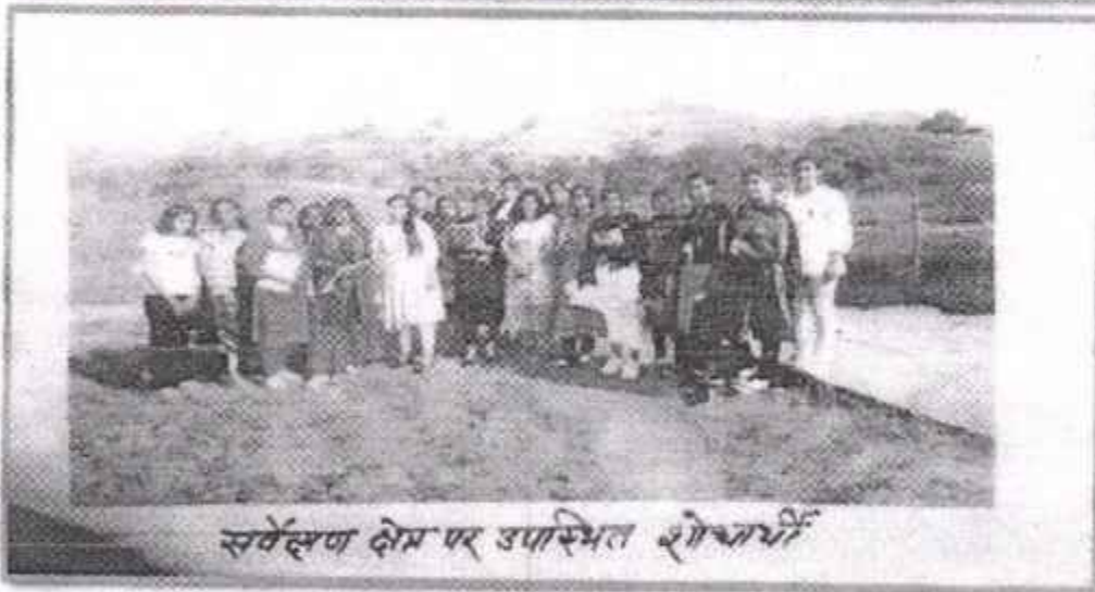
सर्वेक्षण क्षेत्र पर उपस्थित शोधार्थी