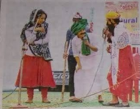
नारनोल के महिला कालेज में सांस्कृतिक उत्सव के दौरान नाटक प्रस्तुत करती छात्राएं = जवाहरण

सांस्कृतिक उत्सव में छात्राओं ने बिखरे सांस्कृतिक प्रतिभा के रंग