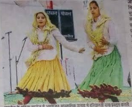
नारनोल के महिला कालेज में आयोजित सांस्कृतिक उत्सव में हरियाणवी नृत्य प्रस्तुत करती छात्राएं